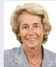
Caroline CAYEUX Présidente Villes de France